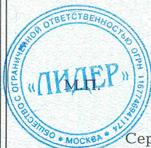
Схема сертификации: 3.